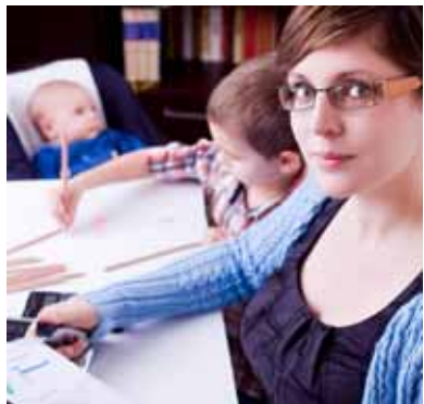
Nachwuchskräfte durch eine Teilzeitausbildung gewinnen.

Mehr im Internet: www.jobstarter.de > Themen > Ausbildung in Teilzeit > Publikationen